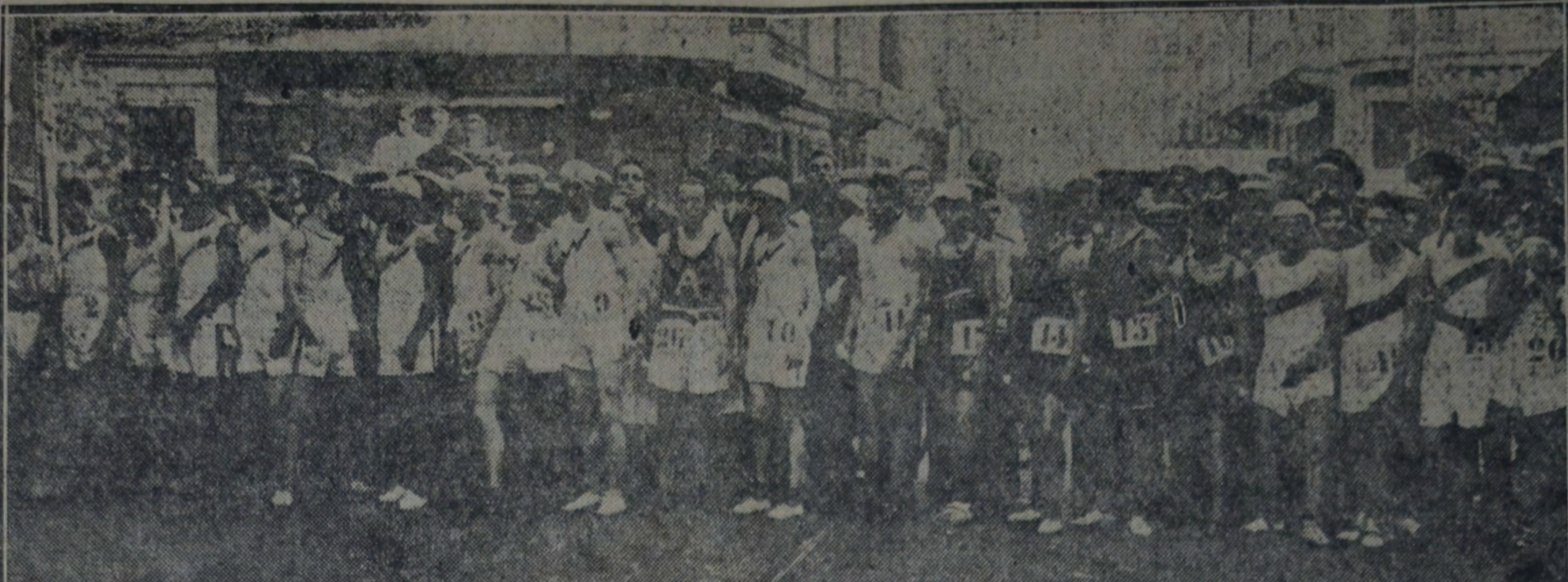
LOS COMPETIDORES, INSTANTES ANTES DE INICIAR LA CARRERA